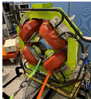
図2 東北大学に設置した4極電磁石