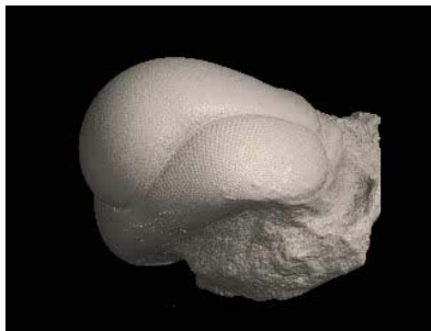
三葉虫Cyclopyge sp.の頭部の立体構築画像

CTを用いて、スキソクローラル・アイおよびホロクローラル・アイの化石について立体構築を行い、自作のソフトウェアをもちいて、各個眼の光軸から視野を読み取った。その結果、ホロクローラル・アイを持つ三葉虫は比較的狭い視野をもち、腹側の個眼密度が高いことが分かった。このことはこの三葉虫が背腹逆向きにして、海中を遊泳していたことを示唆する。