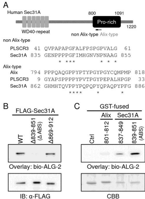
図 1. Sec31A の ALG-2 結合領域の同定 A. Sec31A のプロリンに富んだ領域には、これまでに同定された ALG-2 結合領域と相同性のある領域が 2 ヲ所存在する。B. C. ビオチン標識した ALG-2 を用いたオーバーレイ実験の結果。Sec31A のアミノ酸番号 839 番目から 851 番目の領域が ALG-2 との結合に必要かつ十分である。

ンパク質として動物培養細胞に発現させ ALG-2 との結合能を解析したところ、以前に同定した Alix の ALG-2 結合領域よりも強い結合が検出された (図 1C)。Sec31A のこの領域を ALG-2 結合領域 (ALG-2 binding region, ABS) と名付けた。