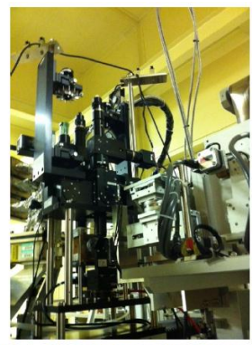
図2 ポータブル加熱测温装置

このような課題を解明するために、以下のような技術開発を行っている。①地球核の条件をカバーする高温高压放射光X線粉末回折実験を可能にする。放射光のX線とブリルアン散乱法を併用してNaCl-B2相などの密度と