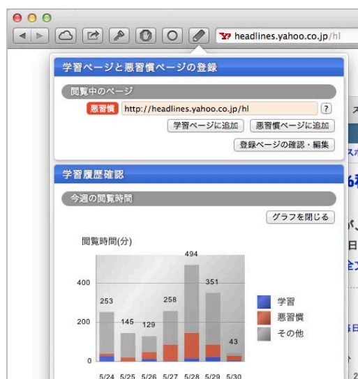
図3. 試作したブラウザ拡張機能