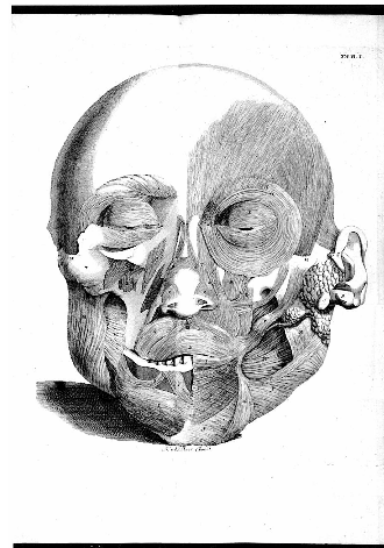
図 3 Santorini の“Observationes Anatomicae”(1739 年) (第二版)における顔面表情筋を観察した図

ータベース構築や、大学ポートレート（仮称）におけるデータの視覚化への応用の可能性を示している。