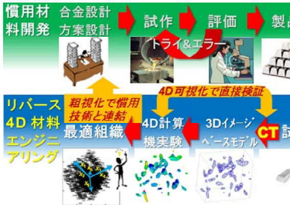
図1 従来の材料開発（上段）とリバース4D材料エンジニアリング（下段）

材料開発では、トライ&エラーを繰り返す（図1上側）ことが常である。また、構造材料では、ミクロンオーダーに限っても、数～数十万個/mm 3 の粒子や欠陥、10 3 ～10 9 個/mm 3 の結晶粒など、膨大な数のマイクロ構造が存在