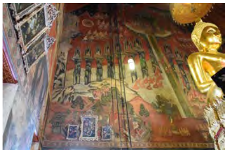
ワット・スワンナラーム布薩堂の三界図

本プロジェクトでは、タイにおける従三十三天降下説話の受容と展開の様相を探るため、タイ各地の遺構や寺院などで現地調査を行なった。中でも三界図と従三十三天降下の組み合わせられたワット・スワンナラームの壁画は、注目すべき作例といえる。