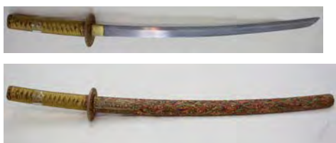
七宝装鞘刀拵（タイ王室財産局蔵）

上記の日本製刀身にタイ製の外装をあつらえたものとしては、タイ王室に伝わった日本刀を例としてあげることができる。七宝装のものは最も位が高く、王ないし王太子のみが所持し即位に臨んで佩用したとされるものである。