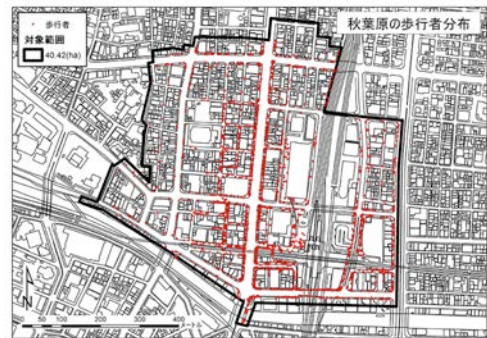
図-2 秋葉原の歩行者分布

広範囲にわたって分布していた。合羽橋・巢鴨は双方の線的分布が一致し、商店街の線的特性が表れた。神保町は、境界要素の点的分布と歩行者の線的分布から密度分布が一致せず、築地は境界要素の局所的分布が歩行者の面的分布に含まれる結果となった。