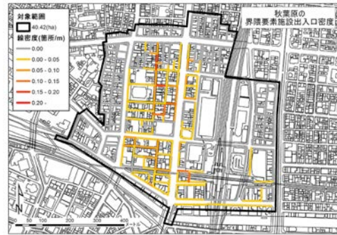
図-1 秋葉原の境界要素分布（線密度）

境界要素と歩行者の密度分布を比較して、調査対象地区の特徴を考察した(図-1、2)。秋葉原は、双方の面的分布が一致し、ともに