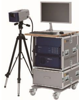
図 1 スキャニング型レーザードップラ振動計 (Polytech PSV-500)

は、レーザー光を照射・受光するスキャニングヘッドおよびコントローラーから成る。さらに、ハードウェアの制御、計測結果の表示・分析等を担うソフトウェアを加え、全体のシステムを構成する。