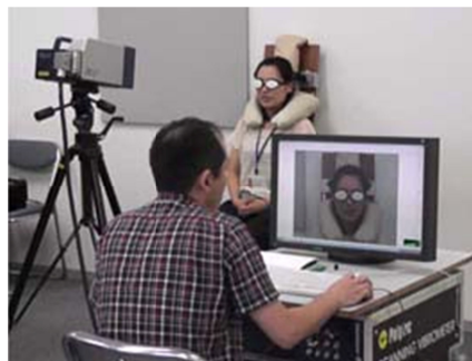
図 2 スキャニング型レーザードップラ振動計を用いた計測の様子 (被験者は椅子に座った状態)

データ収集は被験者が最も発声しやすい音程で母音「あ」、「い」を地声および裏声にて発声している状態で実施した。計測点数は被験者ごとに異なるが、約 70 点から 100 点の間に設定した。