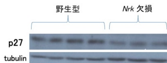
図1: Nrk 欠損胎盤における p27 の発現低下

リンス層の混入なくスポンジオトロホブラスト層を単離することが難しく、サンプル間でラビリンス層の混入の程度の違いによる実験結果のぶれが見られることもあった。そこで、胎盤の切片を用いた抗 p27 抗体による免疫組織染色を行った。その結果、増殖している細胞のマーカーである Ki67 陽性のスポンジオトロホブラスト層の領域において再現性よく p27 の発現低下が見られることが確認された。したがって、 Nrk 欠損スポンジオトロホブラストの過増殖が p27 の発現低下により引き起こされていること、すなわち Nrk がそのシグナル伝達経路の下流で p27 の遺伝子発現の誘導、あるいは p27 タンパク質の分解抑制を引き起こすことが示唆された。