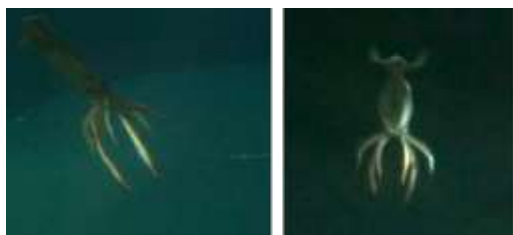
図 1 大型水槽内でのスルメイカの産卵行動

② 産卵行動と卵塊：大型水槽内での産卵行動の詳細を観察することができた(図 1)。