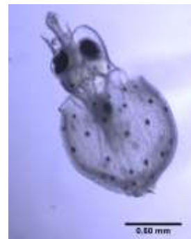
図 3 飼育下で 13 日間生存したふ化幼生

⑤ 卵塊から離脱するふ化幼生の発達ステージ、遊泳行動、およびふ化後の生存：卵塊を目合いの細かな網のケージに収容し、中層に保持した。その結果、21.5℃で 5 日後に Stage 30-31 で卵塊から離脱し、ふ化幼生は表層に滞泳した。最後に、自然海水注入と崩壊卵塊も放置した有機物の多い条件下で、卵黄吸収後のふ化幼生の生残を追跡した。その結果、H26 年は、ふ化後 10 日間生存、H27 年は 13 日間生存した(図 3)。この生存日数は、世界のスルメイカ類の室内飼育では最長記録であった。