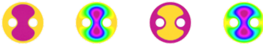
図 3: 円盤から 2 つの小さな円盤を抜いた領域の最小固有値に関する固有関数 [2]

この研究は松江要氏（九州大学）との共同研究である。平面内の有界領域に 2 種類の熱伝導度を持つ物質が与えられたと見え、ラプラシアン固有値が最小となる物質配置を考察した。一般に熱伝導はラプラシアンの第一固有値が主要な減衰項であるため、これによって、熱伝導が最良となる物質配置のモデルと考えることができる。