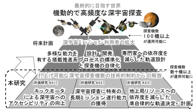
図1 本研究領域の目標と、それを発展させたより大規模な融合領域形成への展望

また、本研究領域がさらに推進されれば、宇宙推進工学にはじまり、多数の宇宙機を低コスト・短期間に設計・製造するためのプロセスの確立や探査機自身が自律的に行動する自律化技術や、限られた軌道力学の専門家でなくとも深宇宙探査の軌道設計が半自動的にできるようにする技術などに至るまで、いわゆる航空宇宙工学プロパーな技術だけでなく、生産工学、設計工学、AI・情報工学等、航空宇宙工学に留まらない多くの分野の融合が進み、究極のゴールである圧倒的に多数の超小型探査機が自在に太陽系を航行する世界の実現も期待される（下図）。