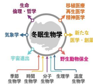
図 2. 期待される波及効果

長期間の低代謝・低体温状態は、ヒトやラットなどの非冬眠動物では細胞傷害や臓器障害を引き起こし致命的である。しかし、冬眠動物でそうした不具合は見られない。本研究領域は冬眠発動の分子機構に対して、解析の方法論と分子的な手がかりとを提供することでその解明への突破口を開くことで、いまだ黎明期の冬眠研究分野が大きく広がるだけでなく、幅広い分野への波及効果が期待される（図 2）。