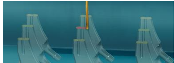
図2 超温度場での結晶成長を活用した3Dプリント。

【超温度場セラミクス材料創成科学】セラミクスにおける超温度場の生成と、その融液成長、気相成長、固体微粒子堆積などへの適用による革新的プロセスの構築、界面の直接観察による結晶成長機構解明による新材料創成のための学術的基盤の創出を行う。