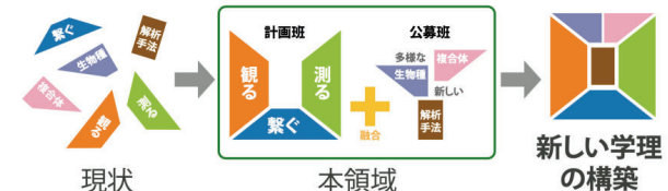
図4 観て、測って、繋いで明らかにする新しい学理の構築を示すイメージ図

「繋ぐ研究」では、環境適応を支える分子装置をコントロールする「制御系」の進化を軸に、植物の集光超分子の構造多様化とそれに伴う遺伝子進化史を比較ゲノム的視座から明らかにし、光合成超分子の構造や機能を環境変化に応じて柔軟に組み変える仕組みを解析する。また、光合成超分子複合体や制御タンパク質の祖先型遺伝子配列および立体構造を情報学的に再現し、それらの情報と環境パラメータを機械学習により総合して超分子複合体の機能・構造解析と環境適応原理を繋ぐ役割を果たす研究を展開する。