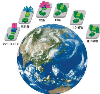
地球上のどこでも光合成ができる謎に迫る

最新の研究成果から、光合成生物は環境に適応する際にチラコイド膜上の基本分子装置そのものは変えず、特定のタンパク質やその組み合わせでできる「超分子」を多様化することで、個別の環境に適応した集光やその制御を進化させてきたと推察される。すなわち、光合成の環境適応においては様々なタイプの超分子装置の機能制御と構造形成を軸に環境適応を理解することが重要であると判り始めたのである。しかし、環境変化に応じてチラコイド膜上で動的に形成される「光合成超分子複合体の構造」と「光合成生物の生理学」を完全に結びつけることは未だ達成されていない。そこで、実績ある構造生物学と植物生理・生化学の研究者が、情報科学を媒体としてタグを組み、時空間的包括性を備えた情報を基盤にして超分子複合体が生理機能の発現を可能にする仕組みを明らかにする。