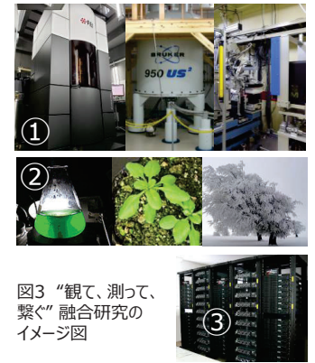
図3 “観て、測って、繋ぐ”融合研究のイメージ図

環境変化に対応する超分子複合体の制御系では、髪の毛の100万分の1（オングストローム）から1000分の1（サブμm）の空間スケールとピコ秒から分の時間幅ではたらくタンパク質超分子を中心に多様な調節機能が働いている。この多次元・多階層システムの理解に取り組むには、①クライオ電子顕微鏡構造解析と高速AFMや分子科学計算を含む先端的構造生物学による可視化技術（＝観る技術）、②非モデル生物にまで展開している信頼度の高い光合成解析技術（＝測る技術）、そして③比較的容易に決定可能となった豊富なゲノム情報を駆使した比較ゲノム解析とAlphaFold2に代表される詳細な予想構造を駆使した情報解析技術（＝繋ぐ技術）の融合にあると考えている（図3）。地球上のどこでもおこるユニバシティな光合成に切り込む我々の研究を『光合成ユニバシティ』研究と名付けて、“観て、測って、繋ぐ”融合研究により初めて到達できる新しい学理の構築を目指す。