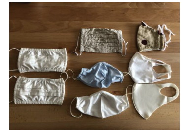
図4 人びとを結びつけ、また分断もしたマスク（2022年10月15日岡山にて撮影）