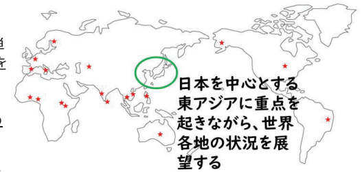
図2 本領域の対象地域

パンデミックの影響はすべての人に等しく降りかかるのではなく、階級やジェンダー、疾患や障害の有無によって、その影響の深刻さは異なる。その実態を明らかにするとともに、差異を乗り越えた連帯の可能性を探る。