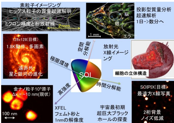
図 1 本新学術領域の目指すもの

これを実現する為に、本領域では半導体技術者と宇宙・素粒子・物質構造等さまざまな分野の研究者等が一体となり（図 1）、産業界の技術を活用しながら、研究開発を進めて行く。