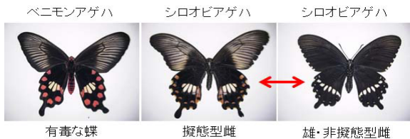
図1 シロオビアゲハのベイツ型擬態

体表の紋様や体色により捕食者を撓乱する擬態は広範な生物に認められるが、その形成メカニズムはよくわかっていない。擬態のような複雑な適応形質は染色体上の隣接遺伝子群「超遺伝子 (supergene)」が制御しているという仮説がある。しかし、これまでにその分子の実体が明らかになったものはほとんどない。沖縄などに生息するシロオビアゲハは雌のみが毒蝶ベニモンアゲハに紋様や行動を似せる(図1)。我々はこのベイツ型擬態の原因が130kbの染色体領域にあり、染色体逆位によって固定されていることを発見した。この領域には性分化を制御する dsx 遺伝子以外に2つの遺伝子が含まれ、これらが supergene として働いている可能性が示唆された。そこで、本研究では主にアゲハチョウを用いて、① supergene の構造と機能、② supergene ユニットの出現と安定化機構、③ 近縁種での supergene の進化プロセスを解明するとともに、④ 遺伝子多重化や転移因子に起因する幼虫斑紋や蛹保護色の形成機構も明らかにし、ゲノム再編成による擬態紋様形成機構を体系的に解明する。