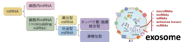
(図2) エクソソーム中に含まれるsmall RNA

我々は癌細胞が分泌するエクソソームに注目した。エクソソーム中にはマイクロRNAなどのsmall RNAが含まれることが知られており、これらは新たな癌診断バイオマーカーとなりうる(図2)。