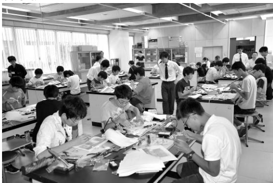
図 2. 国内理科教室 (2017 年度)