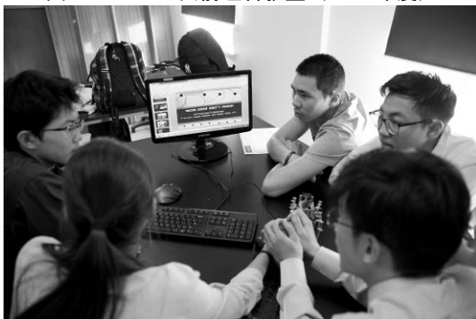
図 4. 2 国間学生協働によるプレゼンテーション