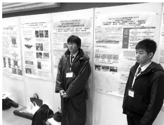
図 5. 高専シンポジウムでの成果発表 (2017 年度)

各年度当初に、サレジオ高専-ものづくり科学教室、モンゴル工業技術大学-ものづくり科学教室の成果報告担当の学生 TA を事前に出して、各種学会にて情報を発信させる。