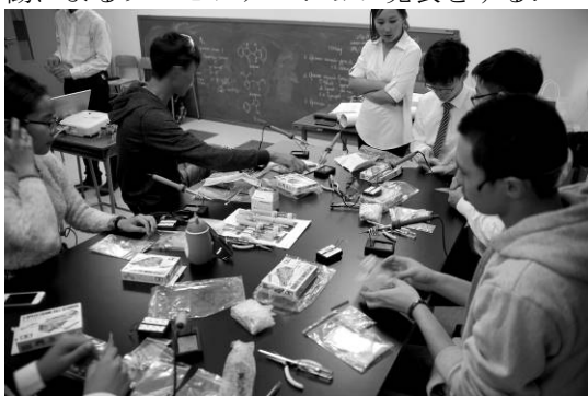
図 3. モンゴル出前理科教室 (2017 年度)

モンゴル国での出前理科教室では、理科教室実施後に PBL としての 2 国間の学生協働によるプレゼンテーションを織り込んでいる。本企画は、教員側でテーマとして「出前理科教室での学び」をテーマとして、日・蒙の 2 国間学生が討議をして意見をまとめ、協働によるプレゼンテーション発表をする。