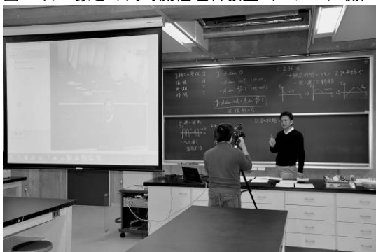
図 8. 日・蒙との物理の遠隔実験授業（2017年度）