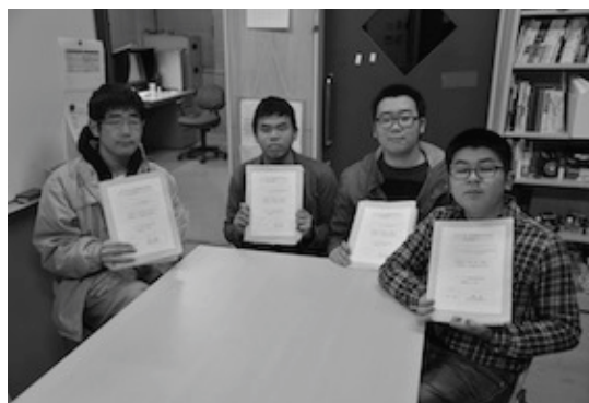
図 9. 学生 TA はポートフォリオにて到達目標管理

2016年度からは、学生 TA へポートフォリオを各自持たせて、理科教室プロジェクトの企画・スケジュールを管理させ、到達目標を年度はじめに設定することで、Step ごとに PDCA サイクルを意識した展開へ改善した。