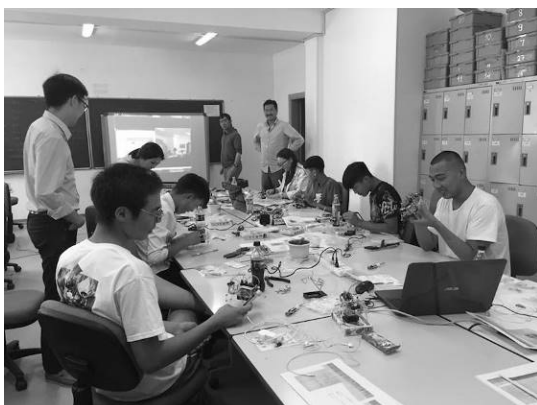
図 7. 日・蒙との同時開催理科教室（モンゴル側）

2015年からは通信システムをNTT ビズリンク社のスマート会議システムへ変更した。理由は、近年、企業で開発している通信システムの発展が著しく、特にスマートフォンやタブレット、および Microsoft の Word や PowerPoint との親和性が高いためである。新システムへの導入の結果、遠隔授業のみならず、国際交流での2国間会議や、遠隔理科教室への転用して実施するに至った。その成果は、日本工学教育協会「工学教育」2017-5 vol.65 no.3へ投稿論文として報告した。