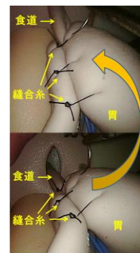
やや見下ろした視野へ変更することが可能。奥の縫合位置の観察が可能となる。

また、結果を踏まえながら、適宜画像システムについてフィードバックを行い、画像システムの精度向上を図る。