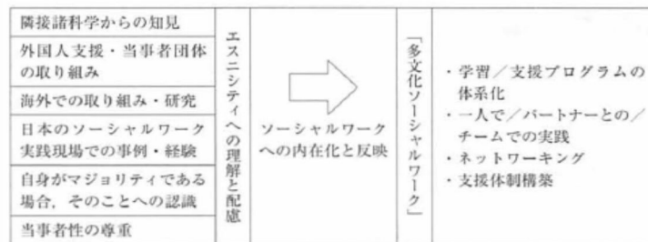
図2 エスニシティに配慮したソーシャルワークの体系化へ向けた課題