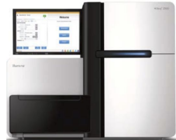
図2 次世代シーケンサー 1ランで40億塩基を読み取ることが可能(AB社 SOLiD-3)

因と発症機序は未だ解明されていない。疾患性差はなく他臓器の先天異常(肋骨癒合、腎奇形など)を合併することが多い。遺伝的に明らかな家族歴の報告はないため孤発性疾患と考えられている。孤発例発症に対する影響度の高い遺伝的要因は、突然変異(de novo 変異)と劣性ホモ変異(両親それぞれからヘテロ変異を受け継いだ変異)が多い。過去に先天性側弯症に対して次世代シーケンサーを用いて、網羅的遺伝子解析(全エクソン解析)を行った報告はない(図2)。