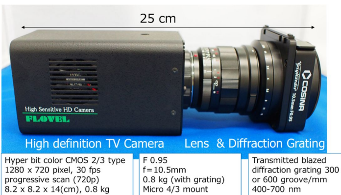
図 1. 観測に使用されたメテオカメラ、レンズ、回折格子

国際宇宙ステーション (ISS) の米国与圧実験棟内に超高感度ハイビジョンカメラ (図 1) を設置し、地球側を向いている窓越しに地球に落ちていく流星を観測する。流星は時間的・空間的に偶発的に出現するため、夜間の動画撮像を行い、観測後の動画から流星データを抽出する。観測システムは、ハイビジョンカメラ、エンコーダ、電源通信ボックス、ラップトップ PC で構成され、これらの機器は全て、観測窓の前に設置されている専用の実験ラック (WORF: Window Observation Research Facility) 内に据え付け、撮像時は暗室状態にして観測を行う (図 2)。ISS は 90 分で地球を一周し、そのうち 35 分が太陽の光が入らない夜間となる。我々は ISS 軌道予測情報に基づき、ISS が夜側に入る日時のみ観測を行うよう、事前に観測スケジュールコマンドをメテオカメラに接続する ISS 上のラップトップ PC にアップリンクし、夜間のみ流星の自動観測を行った。カメラ設定の変更やエンコードのビットレート変更などカメラの制御及び観測データのダウンリンクは、惑星探査研究センター内の運用管制室から NASA のネットワークを介してリアルタイムで行った。ISS と地上の通信データ容量の制限から、20Mbps の観測データを 2Mbps にダウンコンバートして、タイムリーに地上に降ろし、流星の有無を確認した。20Mbps の高解像度データを記録した HDD は観測完了後にまとめて輸送船により地球に持ち帰られた。