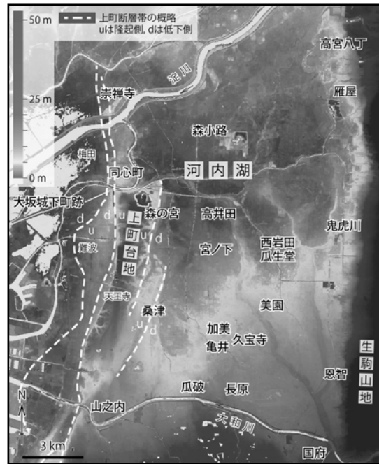
図 1 河内平野における約 2100 年前の主要な遺跡と上町断層帯 (杉戸 2016)

表層地質に関しては、既存ボーリングデータを入手して層相と層序、構造、年代に関する検討を行った。また、2017 年 6 月、名古屋市北区黒川本通二丁目において、沖積層最上部の把握のため、ボーリングコアを取得し (NAG-1~4・計 22 m 長)、観察と記載を行った。コアには旧流路地形と対応する湿地性堆積物および流路堆積物が認められ、計 2 点の放射性炭素年代値が得られた。今後くわしい編年を実現し、長波長の微細な断層変位地形の成立時期等を推定することが期待される。