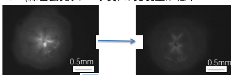
ウスエダミドリイシの幼ポリプ(白く明るい部分がGFP)!

かった。また2本鎖 RNA を用いた RNAi 処理よりも、siRNA を使用したほうが、実験期間中のサンゴプラヌラ幼生生存率が高いことから、本研究では、siRNA を使用することにした。