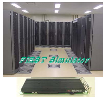
宇宙シミュレータ FIRST(上)と、 その中に組み込まれている Blade-GRAPE(下)

第一世代天体の質量に関する成果は、それまで学界で信じられてきた第一世代天体の質量の見直しにつながった。また、3次元輻射流体力学の実現は、国際プロジェクトに発展し、世界10数グループが参加する Comparison Project が行われた。さらに、SPH法とツリー化された輻射輸送を組み合わせた高速輻射流体力学コード START 開発は、格子法を用いた高速輻射流体力学の実現につながり、3次元輻射流体力学のポテンシャルが一気に高まった。計算機科学への波及効果として、宇宙シミュレータ FIRST の開発は、演算加速器をもつ融合型計算機のさきがけとなり、コンピュータサイエンスの発展に対しても重要な影響を与えた。そして、初代天体と宇宙再電離の研究は、高赤方偏移宇宙観測にも大きな影響を与え、遠方宇宙のライマン \alpha 輝線天体の観測による宇宙再電離の共同研究へと発展した。