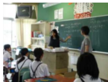
写真 2 ペーパークラフトを使った授業実践

鹿島市及び地元 N P O 法人と連携して H 小学校 4 年生の総合的な学習の時間に「山口醤油醸造場ペーパークラフト」(平成 27 年度科研費研究成果)を使った授業を実施した(平成 28 年度)。子どもたちは学校に隣接する重伝建地区の町並みを構成する山口醤油醸造場をモデルにした初めての紙模型づくりに戸惑いながらも楽しそうに取り組んでいた。授業を通して地域の伝統的な建物の構造や間取りの理解を深め、先人の知恵を学び、伝統的な建物や町並みを守っていくことの大切さを考える貴重な時間となった。平成 29 年度には 5 年生の総合的な学習の時間において「南舟津の茅葺き三棟ペーパークラフト」(平成 28 年度科研費研究成果)を使った授業を実践した。この授業では授業時数の短縮を図るため、3 人 1 組で 1 つの模型を組み立てるスタイルを初めて導入した。授業後の感想文等の分析から、ペーパークラフトを活用した体験的な町並み保存学習を地域や自治体と連携して実践することは子どもたちのふるさと意識を育むのに効果的であることがわかった。