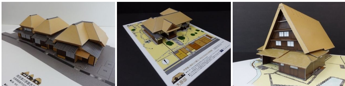
写真1 民家ペーパークラフト (左から、「南舟津の茅葺き三棟」、「大原邸」、「旧遠山家住宅(改訂版)」)

平成28年度は佐賀県鹿島市浜庄津町浜金屋町重伝建地区内の茅葺き民家「南舟津の茅葺き三棟」(旧池田家住宅・旧中島家住宅・旧中村家住宅)を取り上げた。鹿島市内の2つの重伝建地区の内、この地区は江戸時代から鹿島藩の港町として庶民の生活の場となっていた。三棟は多良街道から少し入った狭い路地と水路沿いに建っており、平成21年度に建築当時の明治初期の姿に復元修理された。また平成30年度には、平成29年度に重伝建地区に選定された杵築市北台南台重伝建地区内の「大原邸」(大分県指定有形文化財)をモデルに「大原邸ペーパークラフト」を開発した。江戸時代後期の武家屋敷である大原邸は重伝建地区の町並みに加えて、杵築藩上級武士の当時の暮らしや生活文化を学ぶのに格好の教材と考えた。