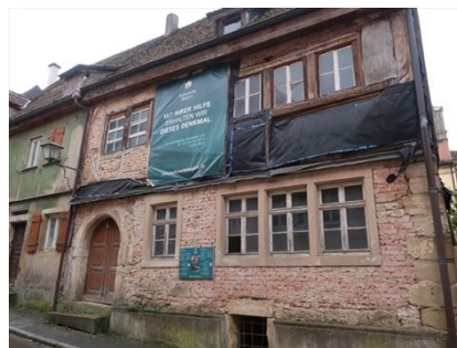
写真3 歴史的建造物の修復現場

ローテンブルク市役所では城壁内市街地における町並みや歴史的建造物の保存に対する法制度、具体的な建築規制、組織・体制、学校における町並み学習の取組状況等について担当者から聞き取り調査を行った。城壁内では条例に沿った厳しい建築制限の適用により良好な町並みの形成・維持が行われていたが、観光客の増加、マンパワーの確保など新たな課題への対応が求められていることがわかった。次に、城壁内市街地に残る旧ユダヤ人街の住居(Judengasse 10, 12, 1409年頃建築)の内部を見学し、バイエルン文化遺産協会による歴史的建造物の保護・修復状況を調査した。建物内の地下にはミクヴェ(沐浴場)があり、上層階には家庭生活や社交のためのスペースを有するなど当時の暮らしを知ることができる状態にあった。学校教育における町並み保存学習については現地事情から調査を行うことはできなかったが、市役所担当者の話によれば特別な教育は行われていないとのことであった。