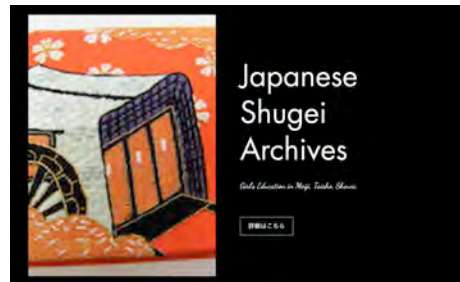
図 3 HP 版データベース トップページ

本研究のデータベースに触れ、現存手芸作品に興味を持った学生のうち 4 名が計 7 点の復元作品を制作し卒業研究として取り上げるなど、データベースによって学生の学びを活性化できた。博物館を訪れる機会が少ない学生にとって、SNS 型のデータベースで手芸作品を目にすることは、学びの機会を広げることが十分に考えられる。しかしその一方で、博物館の作品公開については、各館独自の基準があり、相互利用、画像の著作権、公開、外国語等に対応等については協議する問題点は多く、すぐには実現化が難しいことも課題として残った。海外では V&A、メトロポリタンミュージアム等がすでにインスタグラムを利用して積極的に作品を公開し、多数のフォロワーに向けて情報発信をしている。このように多くの人の目に触れる機会を増やすことが、日本の手芸文化への興味を高め再評価につながると考えられる。日本の手芸文化を発信するためには、将来的に画像公開に関する問題を解消すること、一般ユーザーから博物館関係者までが使いやすいフォーマットを用意することが重要であることが明らかとした。