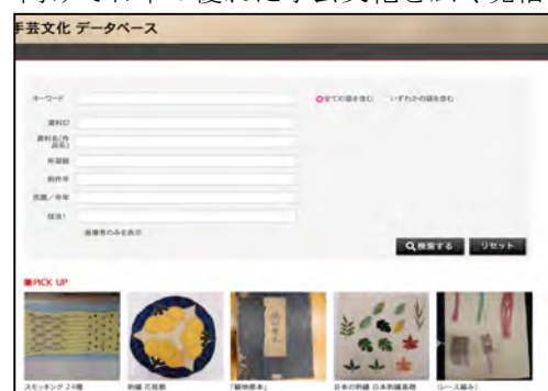
図 1 手芸文化データベース トップページ

被服教育受講の学生 30 人、および手芸を趣味として行っている一般ユーザー 4 名にデータベースを使用してもらいアンケートおよびインタビューを行ったところ「自分の大学でこのような手芸作品が所蔵を知らなかった」「いろいろ見られて面白い」と全員が興味を持った。しかし「検索機能は便利であるが、技法の知識がないと利用しにくい」という意