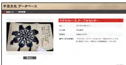
図 2 手芸文化データベース 作品詳細ページ