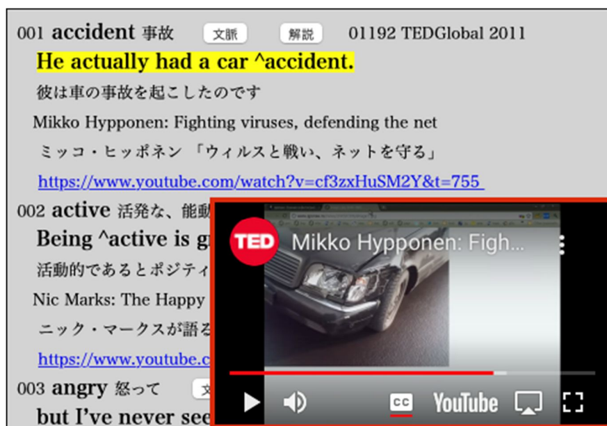
図5：701-800の英単語のリスト

図4の8.0701-0800のリンクをクリックすると、『新 JACET8000 語彙リスト』の語彙レベル701-800の英単語のリストが図5のように表示される。この図では、見出し語 accident の 文脈 ボタンをクリックして、この用例が使用されている TED Talks の動画を再生している。