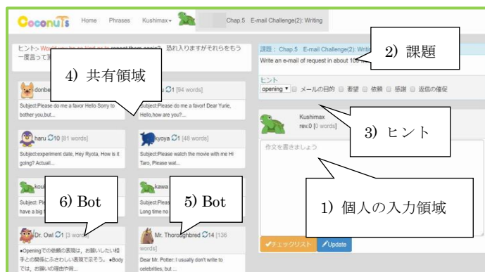
図1 ライティングシステム Coconuts の基本画面

設計方針②に基づき Bot は、5)のモデルライティングを表示する Bot、6)の助言を提示する Bot の2種類が設定され、4)の共有領域に一定の時間を置いてフレーズ毎に自動的に出現する仕組みになっている。