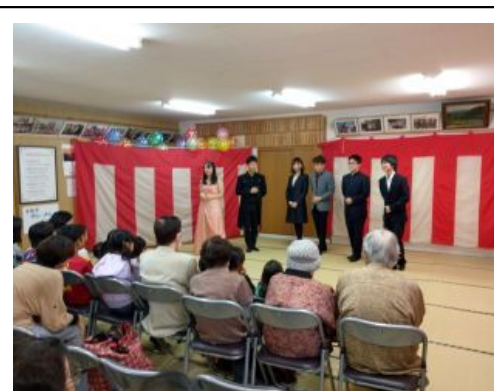
町内会の行事で定期公演を行う近隣の大学の手品愛好サークル