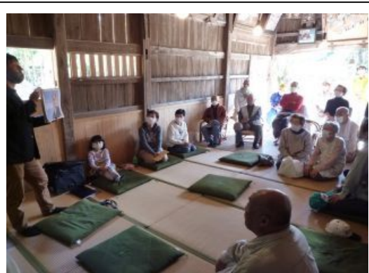
神社と歴史に関するワークショップ 地域の歴史と神社内にある記録をもとに、氏子・町内会の双方から依頼されて実施した。氏子であっても神社の歴史をよく知らない人が多い。 参加者 25名

神社宗教と町内会の分離問題は、単なる「懐古・保守」と「自由・革新」の対立では片づけられない様々な要因がある。根拠とすべき過去の事例も、法や判例・生活習慣・人間関係など考慮すべき範囲が広い。また町内会長や役員が会員に強く指示されている必要があり、十分な地域維持力が試される機会となることが示唆された。また町内会と神社の分離を果たしている町内会は、過去に問題を乗り越えた実績があり、地域維持力の一端を表すとも考えられる。また分離が完了している町内会の中には、単に宗教を排除せず、分離の上に成り立つ協働活動が行われている例もあり、対外展開力の一端をも示す可能性がある。事例によっては大きな困難が予想される。既に分離を確立している町内会も多く、さらに事例にあたりと情報を収集する必要がある。