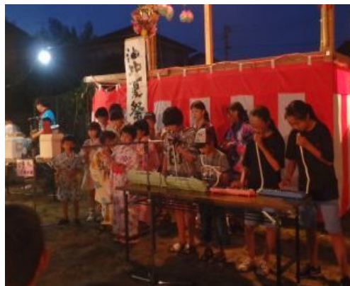
夏祭り: 町内会が独自に企画する行事 小学生が楽器を演奏している。この種の「町内まつり」は、プログラムの制約がなく、新しい企画を取り入れやすい。