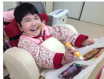
笑顔溢れる実践(掲載の許諾を頂いています)

本研究活動は、合理的配慮や UDL (Universal Design for Learning) に基づく貴重な取り組みとして、世界的にも注目を集めるようになってきている。毎年 15,000 名を超える小中高の教員が集う International Society for Technology in Education (ISTE) の 2018 年度の大会においては、研究代表者は 2 つのセッションのパネラーとして招待され、日本発の本研究活動の取り組みを紹介し、大きな反響を呼んだ。また、2018 年 4 月には、サウジアラビアのリヤドで開催された 6 th Teaching and