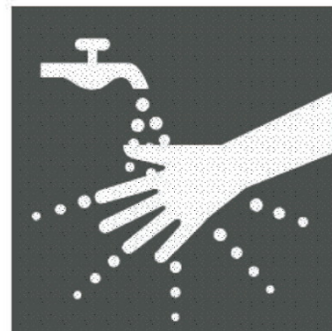
ドットコードが付加された絵カード