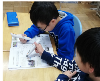
弱視の児童の音読活動で活用