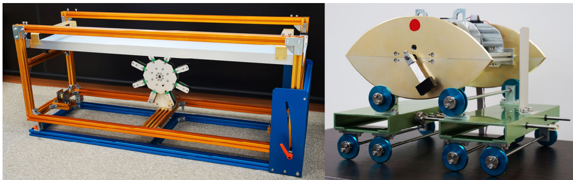
図2：移動ロボットを駆動源とした物体搬送システムを構成する各種装置