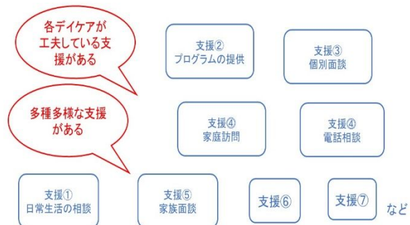
図 2. デイケアの生活支援

その結果、各精神科デイケアが独自の生活支援を提供しており、生活支援の内容は複合的で包括的な特徴のあることを明らかにした。精神科デイケアは、20 歳代から 70 歳代までの幅広い年齢の利用者の生活背景や利用目的に合わせて、生活支援を提供していた。精神科デイケアを利用する人の中で、統合失調症をかかえた人が最も多い。精神科デイケアは統合失調症をかかえた利用者に、プログラムや定期的な面接、会話などを通じて複合的で包括的な生活支援を提供していた。今後は、統合失調症をかかえた利用者への複合的で包括的な生活支援を明確にする必要性が明らかになった。