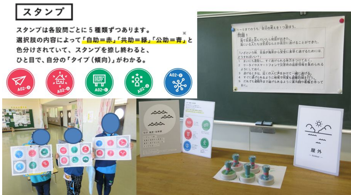
図1 日本での防災スタンプラリーの様子

防災スタンプラリーとは、災害に関連する場面で、自分の行動を選択する。例えば、「海で遊んでいるときに、大きな地震が起きた。」という場面が提示される(図1右上)。どのようにすれば、災害からの被害を最小限にできるのかという問いに対して、1)スマートフォンで常に情報を収集しておく、2)逃げる際に声を掛け合いながら一緒に逃げる、3)わかりやすい避難ルートを看板で掲示しておくなどの選択肢の中から、自分の考えに合う選択肢を選ぶ。選んだ選択肢ごとに、自助(赤)・共助(緑)・公助(青)ごとに色分けされており、該当するスタンプを台紙に押ししていく(図1左上)。参加者は、場面ごとにどうすれば災害の被害を減らすことができるのかを考えて、スタンプを押ししていく(図1右下)。最終的に、参加者の意見を反映したスタンプが押される(図1左下)。