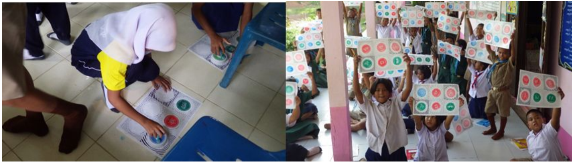
図2 タイでの防災スタンプラリーの様子