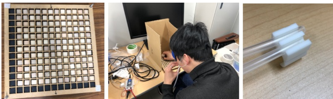
図 2. 指先からの吸気によるニオイ追跡実験

実施最終年度である 2018 年度は、これまでの実施期間で開発した嗅覚刺激デバイスを用いて、指先からの吸気による身体運動と連動した条件と頭部を能動的に動かした条件におけるニオイ源探索能力精度を比較検証した。本実験は実施初年度より行っている、ニオイ源定位に関する実験の発展的研究であり、これまでに明らかとなった風などの外的要因よりも腕などの身体動作がよりニオイ源の方位知覚に影響を与えている可能性が高いことをさらに検証することを目的として実験を行った。実験は、図 2 に示すように、ニオイを染み込ませた 1cm 角のひのきブロックと無臭のブロックをグリッド上に配置し、視覚情報を遮蔽した状態で指先からの吸気および実際に鼻からの吸気した条件の 2 条件でどちらがニオイつきのブロックが形成する軌跡を追従できるかの実験を行った。実験に際して、いくつかの無臭のブロックに紙やすりを貼り付け、触覚刺激のみを頼りに触覚刺激があるブロックのみを追跡する課題では、すべての被験者が指先からの触覚刺激のみで提示した軌跡を追従できた。実験結果より、指先からの吸気および鼻からの吸気のどちらの条件においても、ニオイつきブロックのみを追従することはできず、探索時間も触覚刺激のみをたよりにした追従実験では 1 分以内で追従できていた課題も数倍長く探索しても追従精度は極端に悪かった。今後は刺激への順応を考慮し、異なるニオイを染み込ませたブロックを追従する課題を設定することで、より詳細に身体動作とニオイ源追従に関する特性を明らかにしていく。