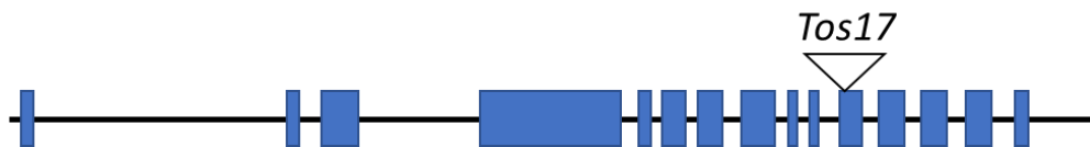
図4 細胞膜プロトンポンプ遺伝子の変異体

本研究で得られた結果をまとめると、植物ホルモンのオーキシシンは細胞膜プロトンポンプを介して導管輸送を正に制御し、その一方で環境ストレス条件下で誘導される植物ホルモンのジャスモン酸やアブシジン酸は導管輸送を負に制御する可能性が示唆され、植物ホルモンのクロストークにより導管輸送が調節されていることが推察された。