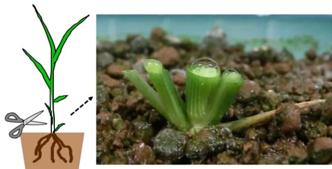
図 1 導管液採取の方法

RIL を用いた遺伝解析には遺伝子型データと表現型データが必要であるため、その二つのデータ取得を試みた。RIL の親品種の次世代シーケンサー解析により検出された 10bp 以上の挿入欠失領域や一塩基置換部位をターゲットとして DNA マーカーを作出し、遺伝子型解析を行った (主な発表論文等 1)。その結果、稲品種「ルリアオバ」と「タチアオバ」の RIL82 系統や「タカナリ」と「べこごのみ」の RIL138 系統に関して遺伝子型データを取得した。表現型データとして RIL の導管液滲出量の測定を試みた (図 1)。滲出量は室内温度や水温による影響が大きく、恒温槽などを用いた実験系を検討したが、多検体に関してデータを取得する際には安定したデータが得られなかった。