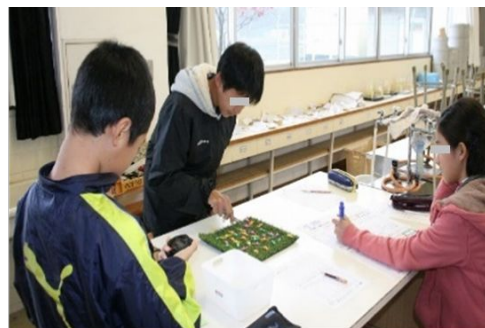
図1 どの色のバッタが捕食されやすかを明らかにする活動(児童が捕食者役)

上記の認識調査の結果を受け、小学校 6 年理科の食物連鎖の単元において、自然選択に関する授業実践を行った(図 1、学会発表)。その結果、授業後は授業前に比べ、目的論的な進化を支持する児童が減り、自然選択の考えを支持する児童が増加した。この授業実践の対象は少数(14 名)であったことから、今後対象者を増やし、同様の傾向がみられるかを確認する必要がある。