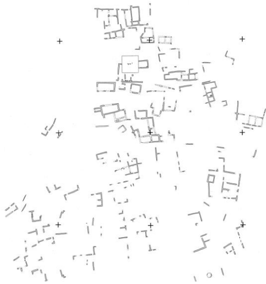
ガーネム・アル・アリのA-D区建物群