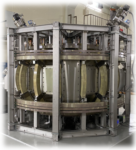
図 PLATO 組立直後の写真

また、直線プラズマ装置 PANTA (現有) を支援研究として活用している。PANTA では準3次元トモグラフィーが完成し[4]、このデータを用いPLATO実験に備えて新しい画像解析法を開発している。Fourier-Bessel 展開法における基底の最適化法[5]、Stokes parameters を用いたプラズマダイナミクスの解析法[6]、また、Fourier-Rectangular 級数展開法[7]などである。また、PANTA で発見された Streamer の物理が深化している[8,9]。理論シミュレーションをはじめとする連携研究では、広く乱流プラズマに関連した成果が多数上がっている[10]。また、PLATO での物理課題が理論的見地から纏められている[11]。PLATO 実験を見据えたプラズマのシミュレーションも開始されている。