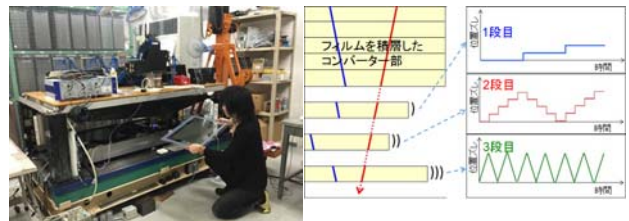
図2 (左) 超高速飛跡自動読取装置 (0.5 m 2 /h)

してコンバーター部内で積層されていたフィルム相互の位置関係を再現し、ガンマ線事象を再構成する。