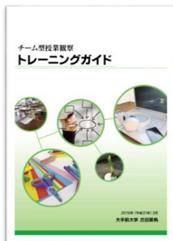
図2 公開したガイドブック

researchmap での「チーム型授業観察トレーニングガイド」の公開（ 図2 ）