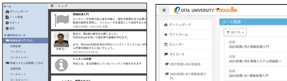
図 2 開発した名簿管理サーバとデータ連携した LePo(左)と Moodle(右)

い自己学習や研修等での LMS 利用も存在する。この学務情報システムが管理しない用途での LMS 利用を管理するための、利用申請・処理に対応する API サーバ / クライアントを開発する。特にクライアントについては、Web ブラウザ上で動作し、必要なデータを API サーバから取得するため、JavaScript フレームワーク [4] を用いて開発する。