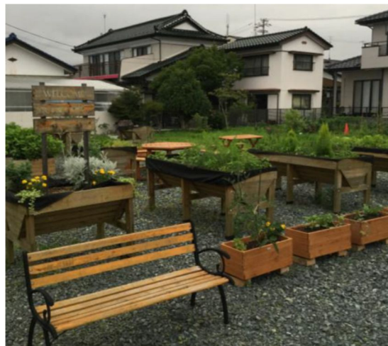
写真1 まちなか菜園事業（2019年7月）

たとえば、補助金が単年度であるため、市役所の担当部署を通じて復興庁への申請・報告といった作業が毎年必要となるうえに、次年度の事業の継続性が担保できないこと、申請・審査・交付という一連の手続きに時間がかかり、採択の可否についての不安を抱えながら企画の準備に着手しなければならないこと、事業補助であるがゆえに