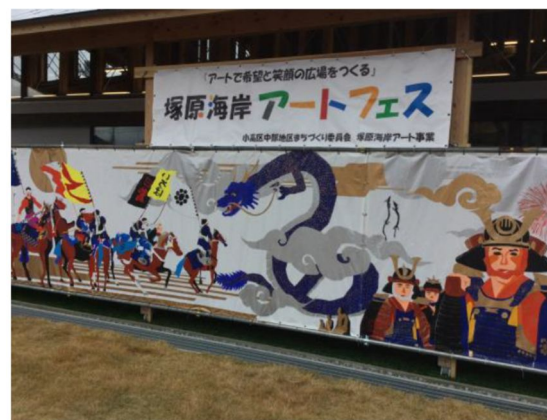
写真2 企画後も展示されている巨大絵シート（2019年11月）