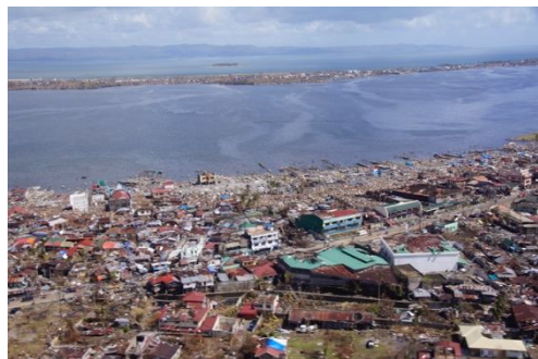
写真1 2013年フィリピン台風レイテ島の被害

沖縄の住宅《風の間》では、ネットによる緑化と雨水貯蔵システムの試みをおこなった。雨水は2階南北テラスの貯水タンクそして地盤面に設けた池へと導かれる。これらの水は、常時は植栽の灌水に用いるが、水不足の際には中水利用できるよう考えている(写真4、図1)。