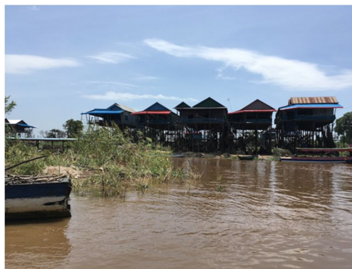
写真2 トンレサップ湖カンポンブロック水上集落