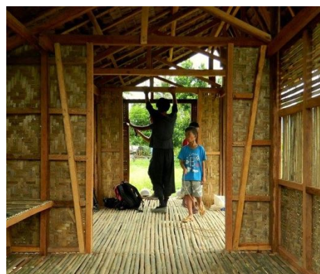
写真5:《バランガイ・コミュニティセンター》