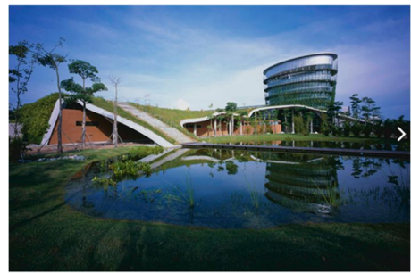
写真3:《FACTORY IN THE EARTH》(©kaori ichikawa)

調査内容は、メコンデルタ周辺の基礎的情報(文献、論文報告書等)を収集整理した上で、集落を選定し、悉皆調査を行う。主に住居実測、住民へのヒアリングを行いその形成過程を