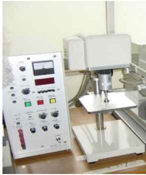
(a) 装置および2cm 2 円形

ここで、 HV ; 触感の評価値(Hand Value)、 C_{00} 、 C_{1j} ; 定数、 X_j ; j 番目の物理量、 m_{1j} ; X_j の平均値、 S_{1j} ; X_j の標準偏差である。