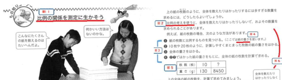
図3. 算数の教科書の問題を分析した結果(杉山・飯高・伊藤ほか, 2007より引用)

問題解決に必要な数学化を行う必要がないことを指摘した。また、分析の※3と※5では、問題解決するための変数として「重さ」が示されているため、問題解決方法が一つに限定されることを指摘した。最後に、分析の※6では、問題解決の手順とデータが示されているため、得られた結果を現実場面に照らし合わせて解釈・検討をする必要性が生じないことを指摘した。これらの分析結果を基にモデリング教材「卒業文集では1300枚必要だが、これで足りるだろうか。ここにある紙の束を工夫して紙の枚数を知ろう」を開発した。小学校6年生6名を対象とした本研究授業において、児童の前に示された紙の束は、児童にとって現実的な問題で、問題解決に必要な数学的モデルと変数が示されていないため、児童達自身がモデリング過程の数学化と解釈・検討を行う必要が生じる数学的モデリングの教材を開発することができた。